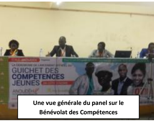
Une vue générale du panel sur le Bénévolat des Compétences