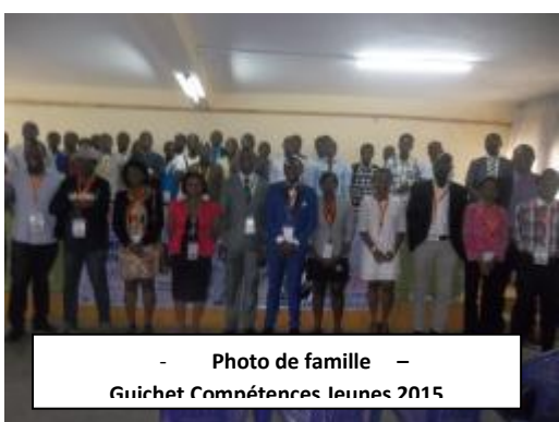
- Photo de famille - Guichet Compétences Jeunes 2015