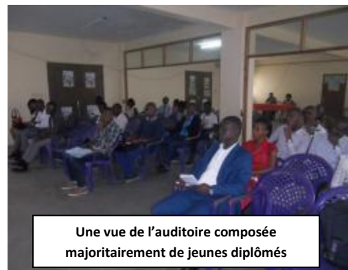
Une vue de l'auditoire composée majoritairement de jeunes diplômés