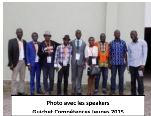
Photo avec les speakers Guichet Compétences Jeunes 2015