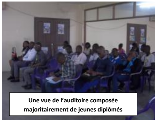
Une vue de l'auditoire composée majoritairement de jeunes diplômés