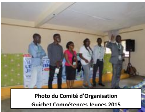
Photo du Comité d'Organisation Guichet Compétences Jeunes 2015